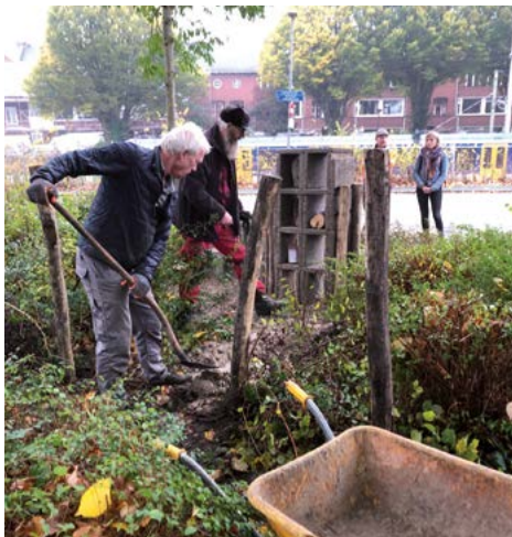
Het insectenhuis op de hoek van de Blekerslaan/Oosterweg